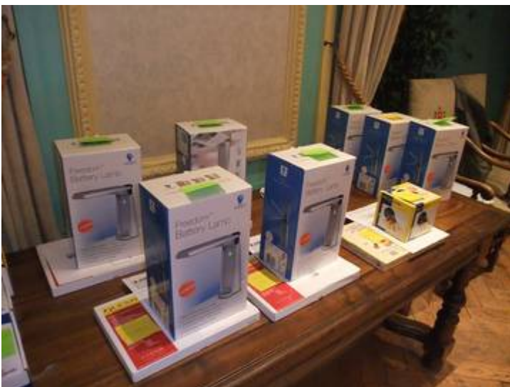
Les Dons destinés aux enfants

Ces 12 jeunes, dont dame nature a commis une erreur d'inattention, ont reçu les matériels adaptés, entourés bien sûr de leur famille, ainsi qu'un ballotin de chocolats à chacun d'eux.