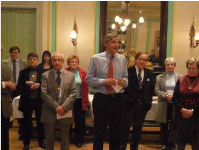
L'accueil de Monsieur Le Député-maire

Nous avons souhaité aider des familles de notre département de Savoie..., dont l'un de leurs enfants a un handicap visuel.