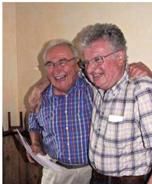
Un moment de complicité entre les 2 Michels lors d'une sortie dans les Bauges !!

Notre Major Prime aura la responsabilité, avec les membres du Bureau, d'assurer l'organisation des manifestations et du recrutement. Il a l'amitié chevillée au corps et la volonté de restaurer les valeurs originelles de notre Compagnie.