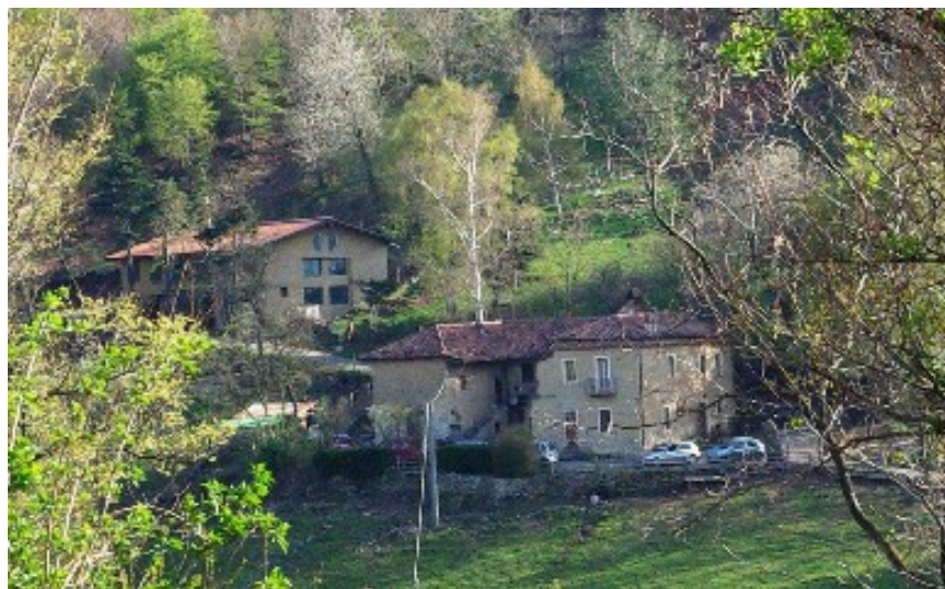
La Cascina dei Canonici