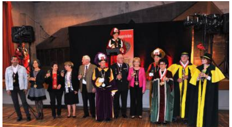
Le Baptême Sartorien

Les Nouveaux Dignitaires et intronisés ainsi que les Compagnons des confréries qui avaient reçu la médaille du Sarto se prêtèrent de bon coeur au baptême Sartorien qui se fait bien évidemment au Vin de Savoie.