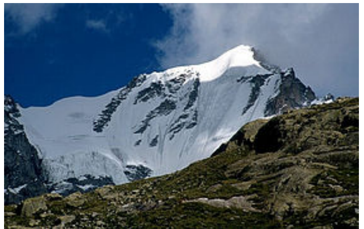
"Le Grand Paradis"