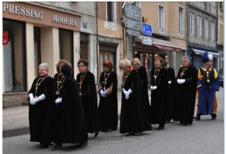
Le Sarto Défile dans les rues de Crémieu

Il faut noter que les confréries de « La Jolie Treille de Tain-l'Hermitage », « La Clairette de Die » ainsi que le « Le Gâteau de Saint-Genis » avaient envoyé un petit mot d'excuses sur leur indisponibilité du jour.