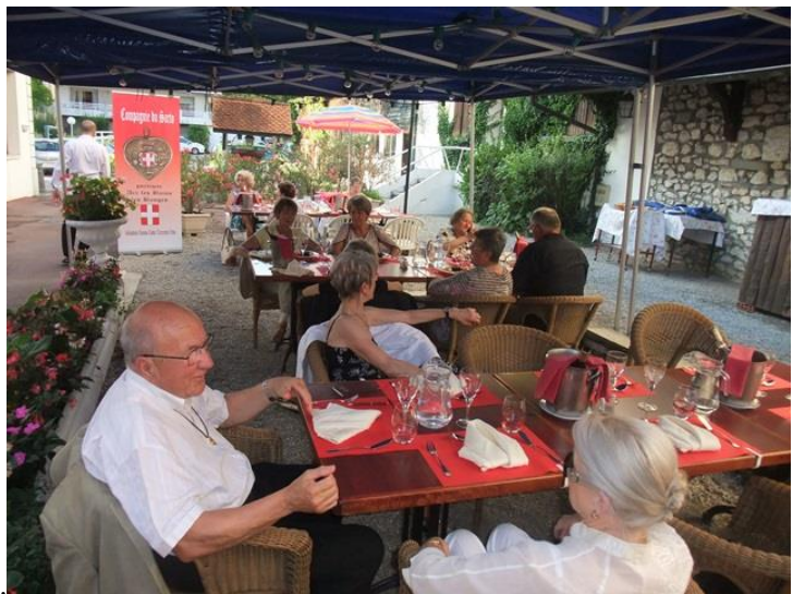
L'après spectacle .... au frais.

Nous avons assisté avec plaisir à l'opérette « la Grande Duchesse de Gerolstein » dans le cadre du festival des opérettes d'Aix les bains ..... suivi du traditionnel apéritif-diner au Dauphinois, servi en terrasse.