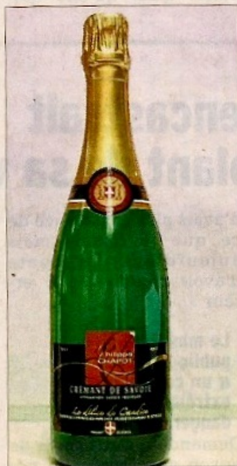
Le Crémant de Savoie surprend par sa qualité de bulles, son élégance et sa finesse.

Le Crémant de Savoie surprend par sa qualité de bulles, son élégance et sa finesse. Il se déguste surtout à l'apéritif mais aussi au dessert. À table, ses qualités lui permettent d'accompagner de nombreux plats.