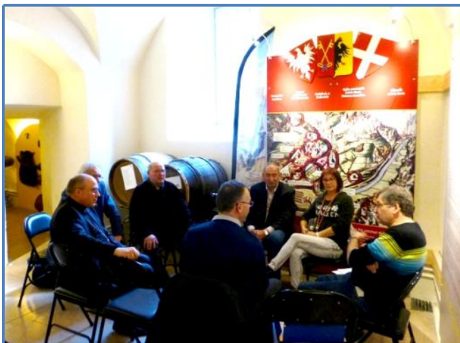
Le Maître du Greffe

« un exemple de réalisation de l'artiste »