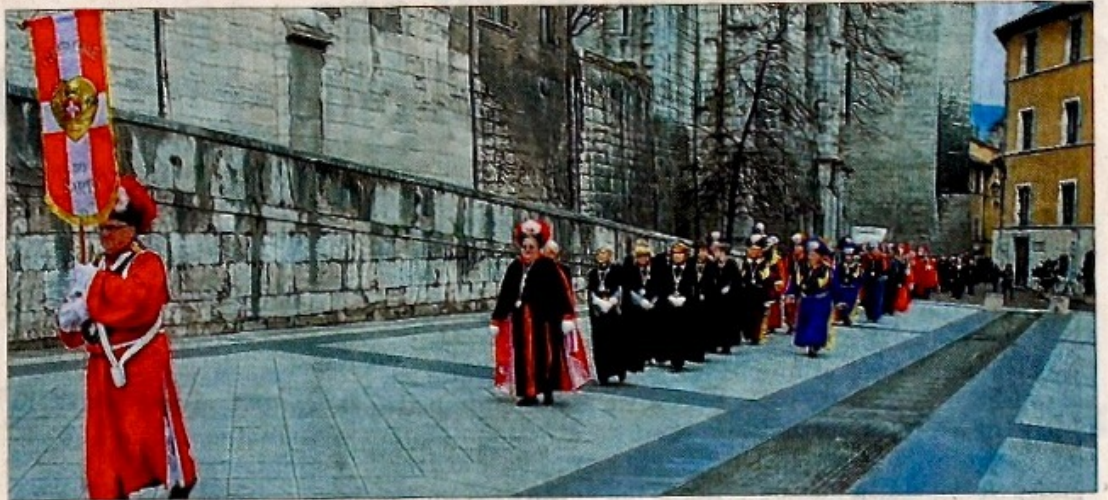
Le Sarto se veut un ordre, une représentation, un enseignement dont les dignitaires revêtent un costume, réplique de l'habit des anciens sénateurs de Savoie.

Les membres, appelés compagnons, sont regroupés au sein de structures locales appelées Vigilances et Portiques. À l'origine, l'ensemble de ces dernières était implanté en Savoie et Piémont et couvrait le territoire de l'ancien Duché de Savoie. De nos jours, elles s'étendent à d'autres territoires : le Jura,