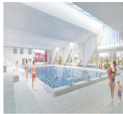
Vue perspective depuis le bassin