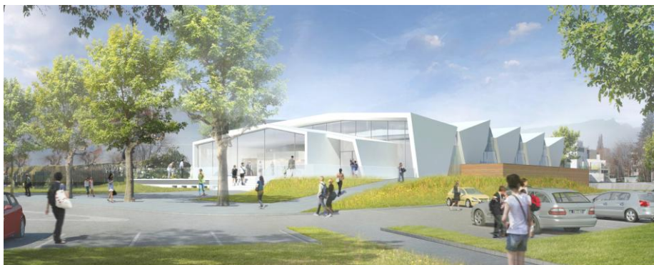
Vue perspective depuis le parking