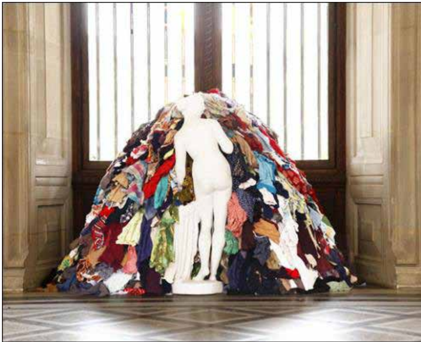
Michelangelo Pistoletto - La Vénus aux chiffons Exposition «Année 1, le paradis sur Terre», Musée du Louvre du 25 avril au 2 septembre 2013

Michelangelo Pistoletto est l'une des grandes figures de l'art contemporain. Par ses tableaux-miroirs d'abord, puis par une série d'expositions et d'événements à la frontière du théâtre et de l'action publique, il a dans le Turin des années soixante posé quelques unes des bases de ce qui allait devenir l'Arte Povera. En 1965, il réalise les «Objets en moins», une série d'œuvres sans unité de style qui marquent un refus de la signature, et représentent pour lui une libération. C'est aussi une manière de répondre à un productivisme de l'art sur le modèle américain. A nouveau exposés à partir des années 90, les «Objets en moins» continuent d'exercer leur influence sur de nouvelles générations d'artistes. En 1998, il crée «Cittadellarte», une fondation qui est un véritable laboratoire, où experts, artistes et chercheurs travaillent à promouvoir une «transformation responsable de la société à travers la fonction génératrice de l'art». Il est aussi l'un des fondateurs de «Love Difference», mouvement artistique pour une politique interméditerranéenne. Depuis, les «Ultime Parole famosa», texte-manifeste de 1967, on sait que l'écriture n'est pas pour Pistoletto une activité secondaire, mais une part essentielle de sa pratique artistique. Avec la publication du «Troisième Paradis», il dresse une forme de bilan et invite chacun à prendre part à la transformation de ce «jardin planétaire».